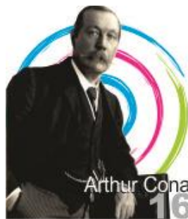
Arthur Conan Doyle